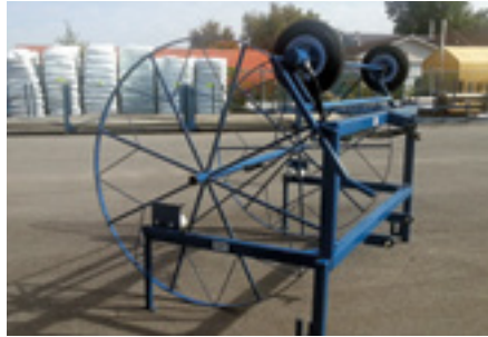
Système de dévidoir pour bâches larges

AgroFabric s'installe en quelques minutes, en plus de se plier en quelques minutes pour l'entreposage.