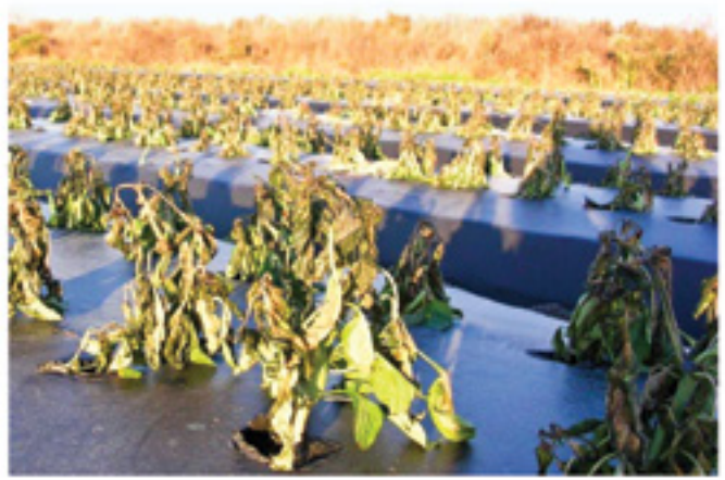
Poivrons couverts à l'aide d'un AgroFabric Pro25 (à gauche). Conservation de la culture pendant 6 heures à une température de -4oC. Culture non-protégée à droite.