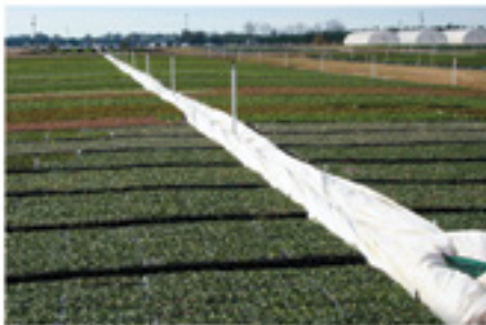
Pro80 prêt à être installé en vue du gel.